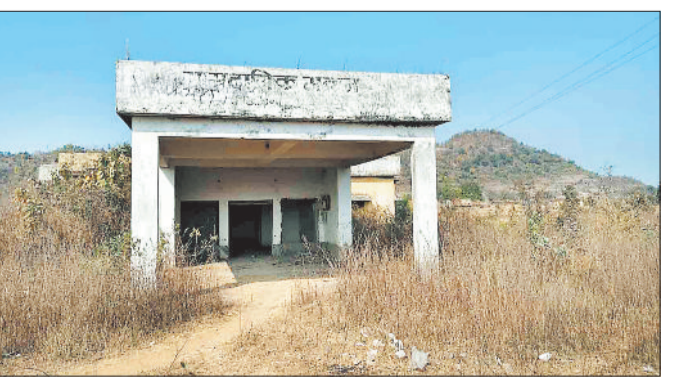
जर्जर सामुदायिक भवन।

शासन प्रशासन द्वारा गांव के विकास के लिए कई विभिन्न योजनाएँ संचालित की जा रही हैं। योजनाओं को लाभ न सिर्फ ग्रामीणों को मिल रहा है बल्कि गांव का विकास भी हो रहा है। ग्रामीणों को किसी सार्वजनिक कार्यक्रम या शादी विवाह जैसी कार्यक्रम में किसी प्रकार की परेशानी न हो इसे ध्यान में रख ग्राम पंचायतों में एक सामुदायिक भवन का निर्माण कराया गया है जिसका लाभ ग्रामीणों को मिल रहा है। ग्राम पंचायत कलामांजी में भी लाखों की लागत से सामुदायिक भवन का निर्माण किया गया परंतु देखरेख के अभाव में भवन अब खंडहर में तब्दील हो गई है जिससे गांव के लोग सामुदायिक भवन से वंचित है। ऐसा नहीं है कि इसकी जानकारी ग्राम पंचायत को