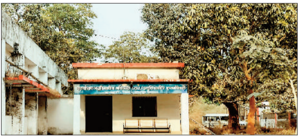
राज्य शासन के राजस्व विभाग द्वारा जारी अधिसूचना के अनुसार, भूमि डायवर्सन की प्रक्रिया 13 दिसंबर 2025 से ऑनलाइन मानी गई है। अधिसूचना में यह भी स्पष्ट है कि आवेदन ऑनलाइन होने के बाद 15 दिनों के भीतर सक्षम अधिकारी की निर्णय देना अनिवार्य है, अन्यथा स्वतः स्वीकृति (ऑटो अप्रुवल) का प्रावधान लागू होगा। इसके बावजूद जशापुर जिले की किसी भी तहसील में न तो पोर्टल चालू किया गया है और न ही वैकल्पिक व्यवस्था को लेकर कोई स्पष्ट निर्देश जारी किए गए हैं। अधिकारी-कर्मचारी यह कहकर परल्ला झाड़ रहे हैं कि तकनीकी कारणों से पोर्टल अभी उपलब्ध नहीं है।

जशापुरनगर। छत्तीसगढ़ सरकार द्वारा भूमि उपयोग परिवर्तन (डायवर्सन) की प्रक्रिया को पूरी तरह ऑनलाइन करने की अधिसूचना जारी किए जाने के बावजूद जशापुर तहसील सहित जशापुर जिले की समस्त तहसीलों में यह व्यवस्था अब तक जमीनी स्तर पर लागू नहीं हो सकी है। स्थिति यह है कि आवासीय, व्यवसायिक और औद्योगिक डायवर्सन कराने आए आवेदक आज भी एसडीएम कार्यालयों के चक्कर काटने को मजबूर हैं।