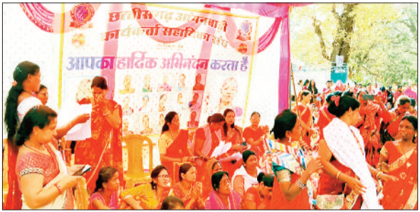
हरिभूमि न्यूज | जशापुरनगर

संयुक्त मंच के आह्वान पर तीन सूत्रीय मांगों को लेकर छत्तीसगढ़ आंगनबाड़ी कार्यकर्ता सहायिका संघ के बैनर तले भारी संख्या में आंगनबाड़ी कार्यकर्ताएं सहायिकाएं दो दिवसीय हड़ताल पर सड़क पर उतर गई हैं, इस दौरान इनके द्वारा धरना प्रदर्शन करते हुवे जशापुर के रणजीता