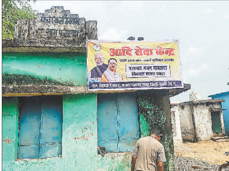
ग्राम पंचायत पलसदा।