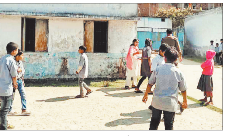
हरिभूमि न्यूज ▶ अम्बिकापुर

बिश्रामपुर। विश्रामपुर रेलवे स्टेशन के समीप ग्राम कुंजनगर के अवरुडगु मोहल्ले में बुधवार को सुबह शासकीय मिडिल स्कूल की कक्षा सातवीं की नाबालिग छात्रा को कथित रूप से कार सवार युवकों द्वारा अगवा करने के प्रयास की फैली खबर से नगर में